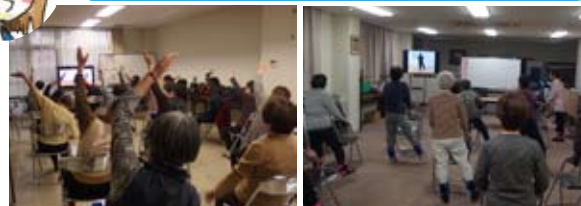
特製のおもりなどを使いながら筋力の低下を防ぐ体操です

参加希望の方は浪速区役所3階33番窓口、保健福祉課へご連絡ください。TEL06-6647-9968