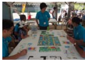
区民まつりで防災ゲーム