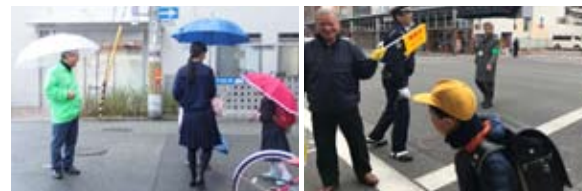
雨の日も安心です