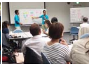
運営についての勉強会の開催