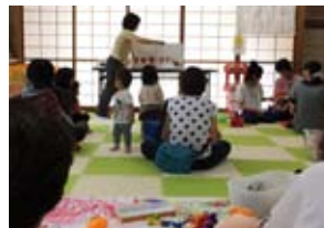
読み聞かせの様子

地活協の活動は地域の掲示板や情報誌、ブログやSNSなどを活用して発信されています。まずはご自身の地域で気になる情報を探してみてください。浪速区役所6階にある地活協の専用ラックでも地域の新聞等を配布中です。