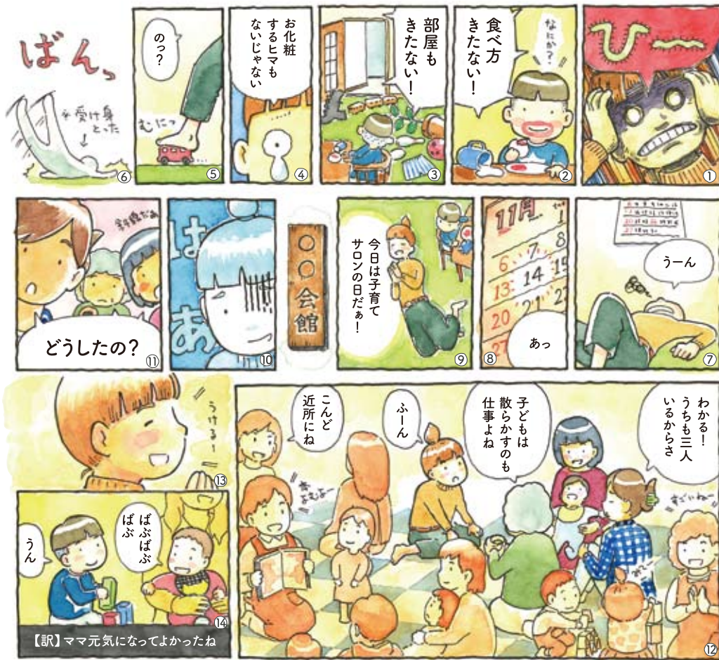
【訳】ママ元気になってよかったね