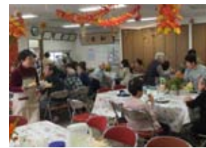
顔なじみができる安心感も

毎月1〜2回、地域の会館で開催されています。予約なしでも参加でき、モーニングセットが100円〜と、気軽に立ち寄れるのが大きな魅力。スタッフはみな、ご近所に住むボランティア。浪速区社会福祉協議会が運営ノウハウを提供し、長い所では10数年続けている地域もあります。